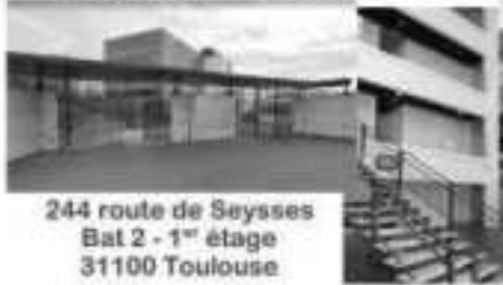
244 route de Seysses Bat 2 - 1 er étage 31100 Toulouse