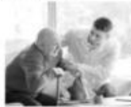
Accompagnant.e de vie