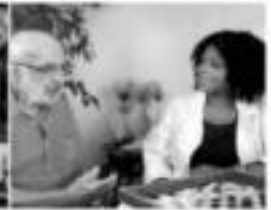
Moniteur.rice / Éducateur.rice