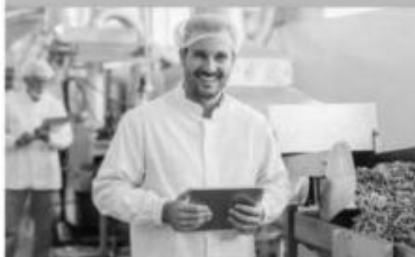
Établissement privé sous contrat avec le Ministère de l'Agriculture.