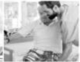
Aide - soignant.e